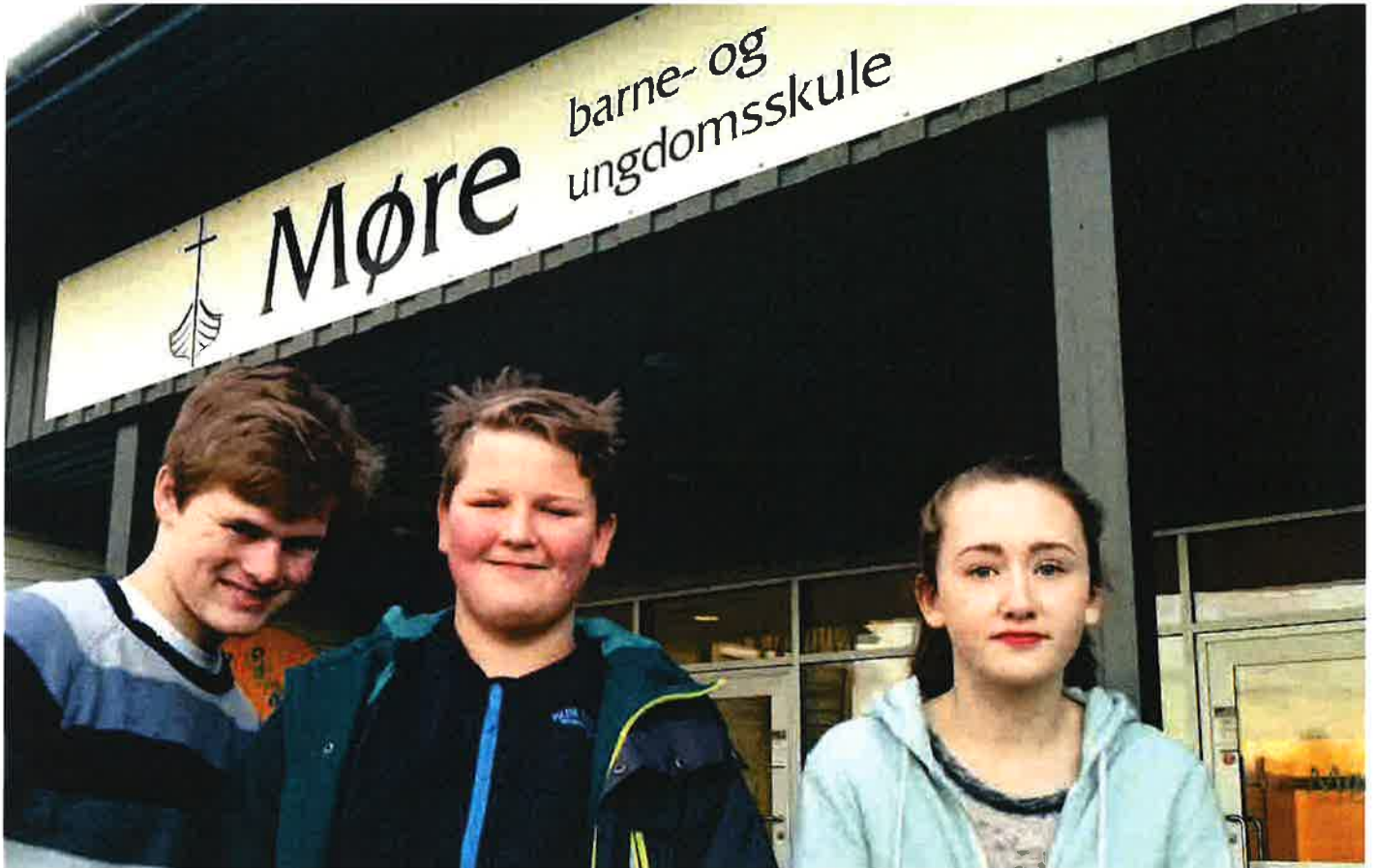
Elevane med Møre barne- og ungdomsskule Herøy gjorde ein kjempeinnsats under misjonsveka.