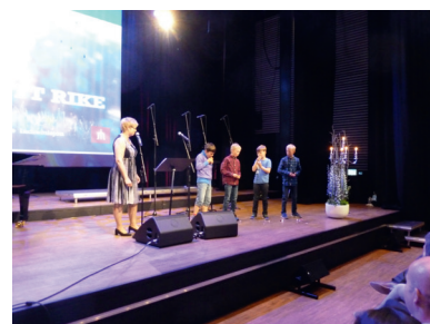
Under familiemøtet søndag i Fosnavåg deltok både born og vaksne.