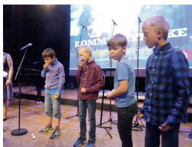
Under familiemøte i Fosnavåg var det innslag for borna.