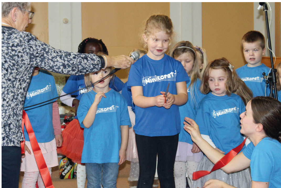
Barnekoret frå Ellingsøya klypte snora og opna fjorårets Radiomessa på Ålesund bedehus.

Radiomessa i år vert det også noko endringar på. Vi har også heva beløpet vi satsar på å samle inn denne dagen, og har med det også flytta messa frå Ålesund bedehus til Borghallen på Borgund folkehøgskule. Med det håpar vi på endå fleire folk, og meir sal av både mat og lodd. I tillegg vert det både aktivitetar for borna, det blir song