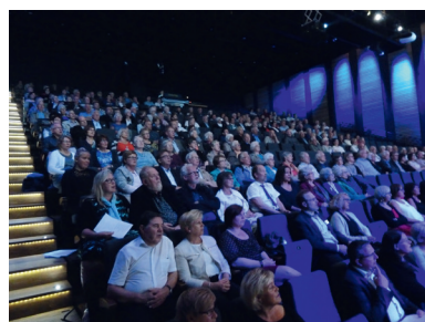
Det var mange som møtte fram under konsert og festmøte i Fosnavåg.