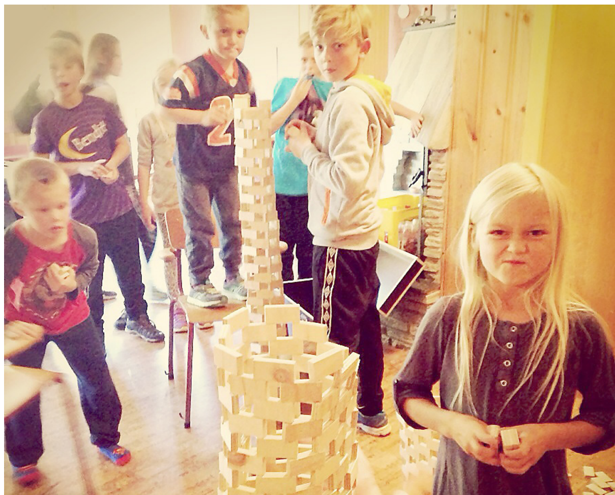
Borna i full sving med kreativ aktivitet