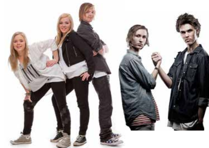
Team Sulebakk og KløverKnekt&Skarre r. kommer også!

Dette blir med andre ord en strålende kveld, så det er bare å skrive det inn i kalenderen med en gang. Ta med deg en venn eller fire og kom, for dette blir bra!