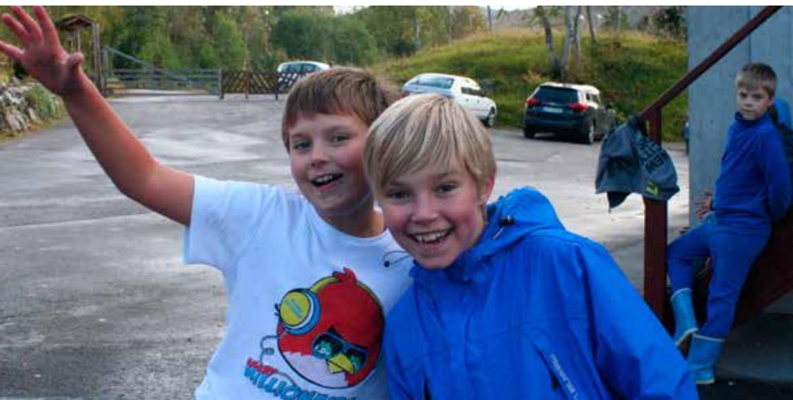
Kjekt med leir på Orreneset synst desse to karane.

Prosjekt Asfalt er i startgropa! Prosjektet er gjort mogleg av eit stort spleiselag i høve 30 års jubileumet for Orreneset misjonssenter.