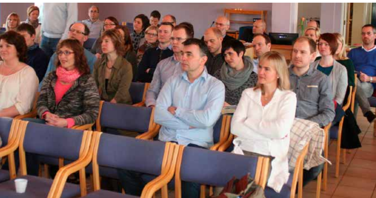
Utfordrande og kjekt med Lev Livet-dag på Emblem