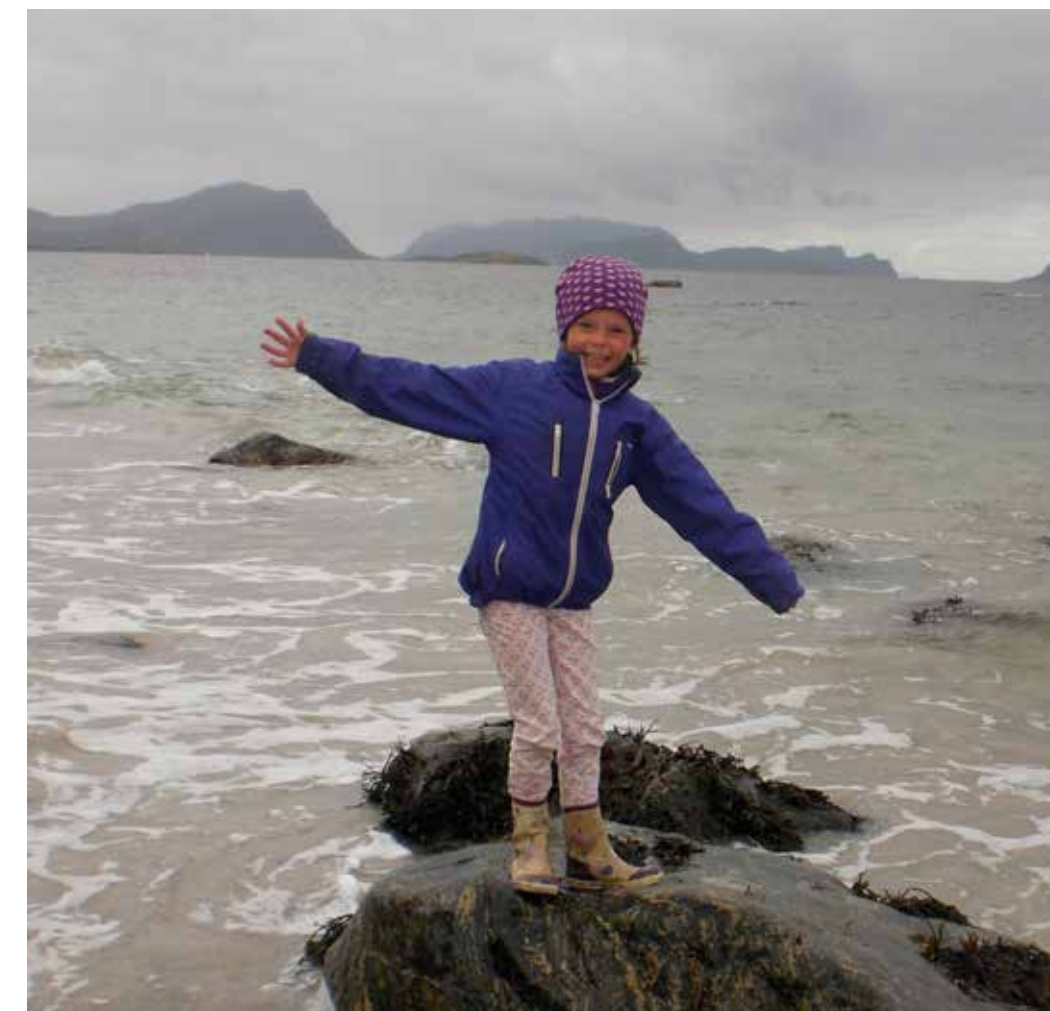
På sommartreffet på Herøy kan du oppleve naturen tett på kroppen.

Herøy har mykje å by på! Vi kan nemnte Hakkalegarden, Runde Miljøenter, Ishavsmuseet på Brandal, Flø og flotte turstiar. Kva med å leige ein båt og køyre rundt Runde? Eller sitje i båten utanfor Fosnavåg med fiskestanga i hendene? Campingplassar, båthamner og hotell, overnattingmulighetane er mange. Så set av helga allereie no! Velkommen til Sommartreff!